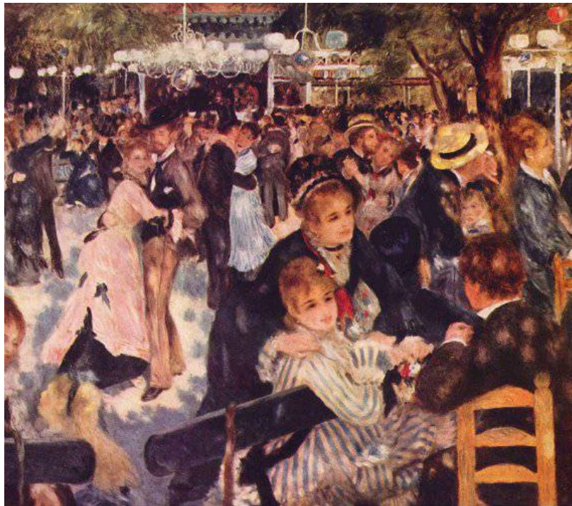
Le bal du Moulin de la Galette – Auguste Renoir

http://www.bilderkostenlos.org/Kuenstler/Claude%20Monet/das-Mittagsmahl.jpg.html