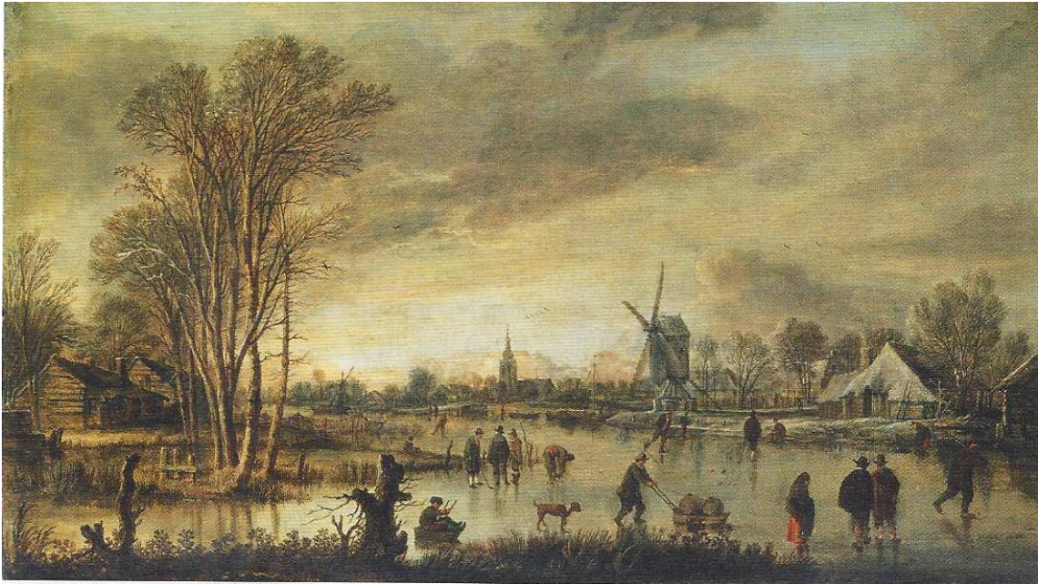
Paysage avec rivière en hiver – Aert van der Neer – 1645