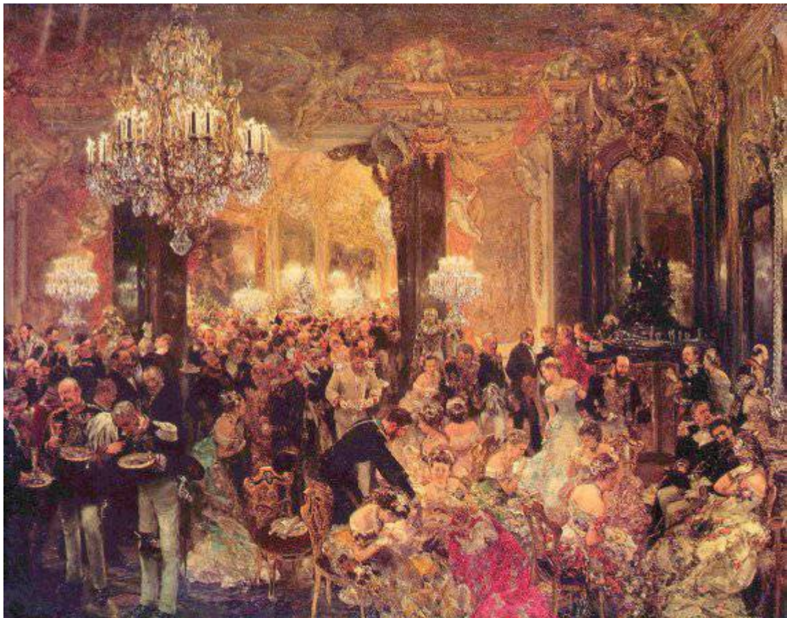
Ballsouper – Adolph Menzel

http://www.bilderkostenlos.org/Kuenstler/Camille%20Pissarro/Boulevard-Montmartre.jpg.html