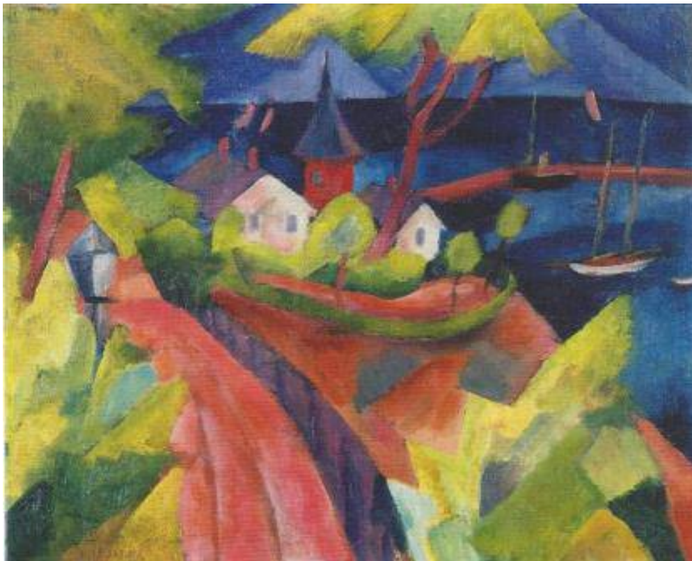
Wieck near Greifswald – Paul Adolph Seehaus – 1916