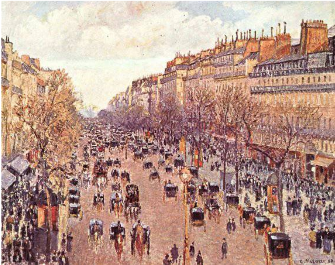
Boulevard Montmartre – Camille Pissaso

http://www.bilderkostenlos.org/Kuenstler/Camille%20Pissarro/Boulevard-Montmartre.jpg.html