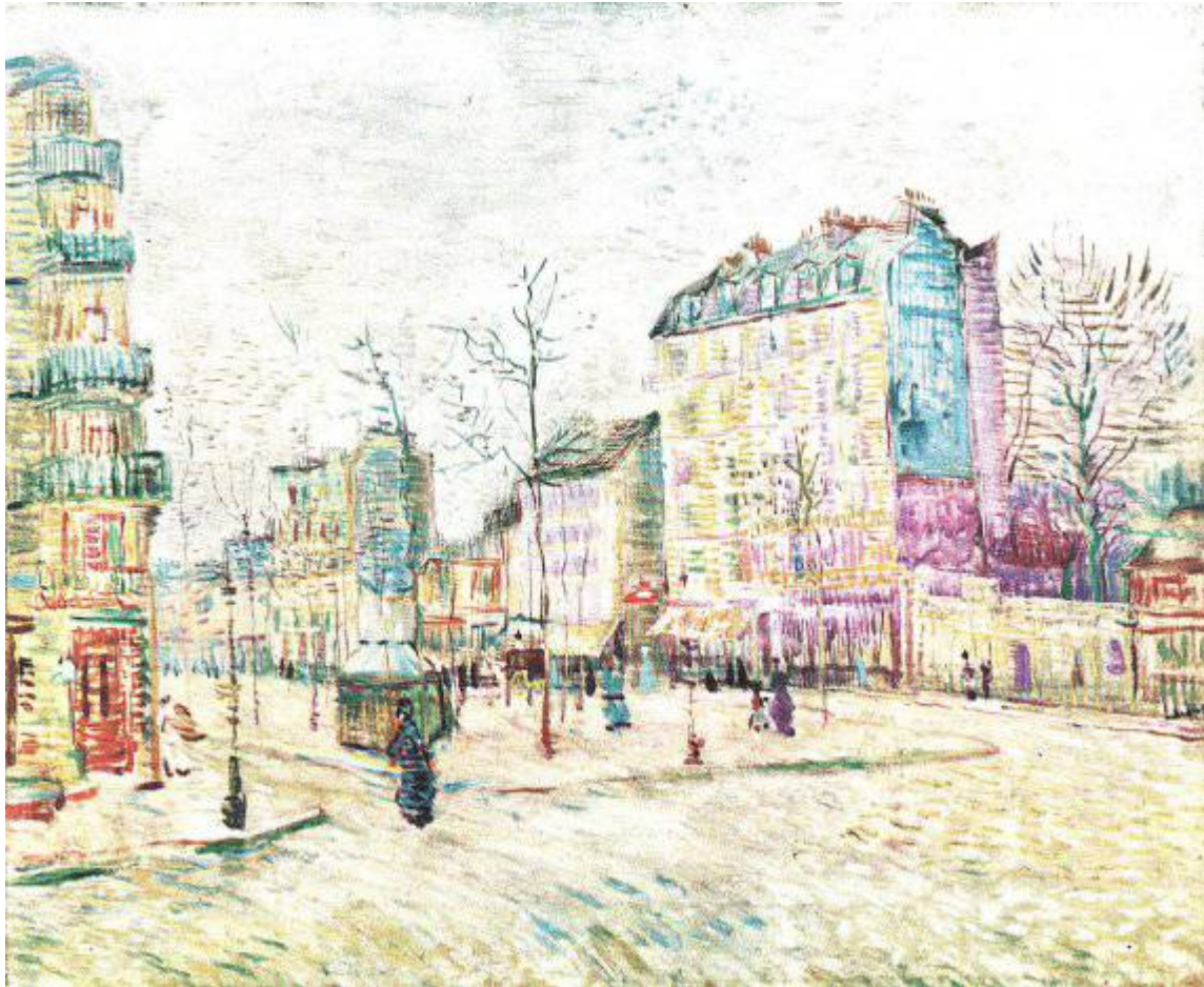
Boulevard de Clichy – Vincent van Gogh http://www.bilderkostenlos.org/Kuenstler/van%20Gogh/Boulevard-de-Clichy.JPG.html