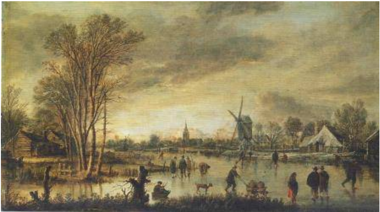
Landscape with river in winter – Aert van der Neer – 1645