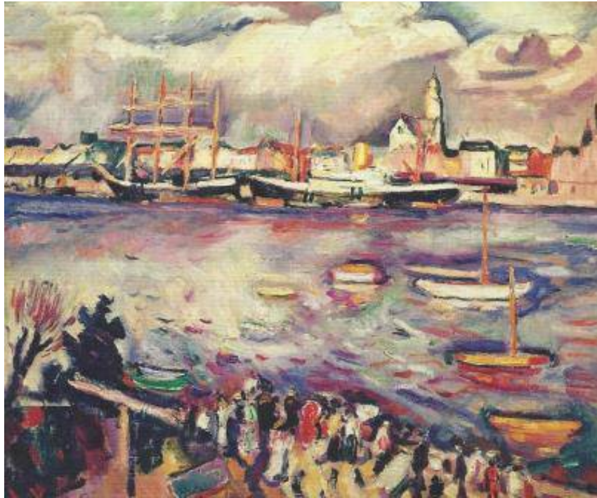
The port of Antwerpen - Emile Othon Friesz-1906